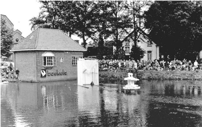
Plaatsing beeld (cadeau personeel) in de vijver t.g.v. het 75-jarig jubileum (foto: boek Boekelose Stoomblekerij, door Bart Stuiver)

Het portiershuisje stond aan de Boekelosestraat in een vijver. Daarnaast sloot een hek het fabrieksterrein af; men moest echt langs de portier om naar binnen te kunnen gaan.